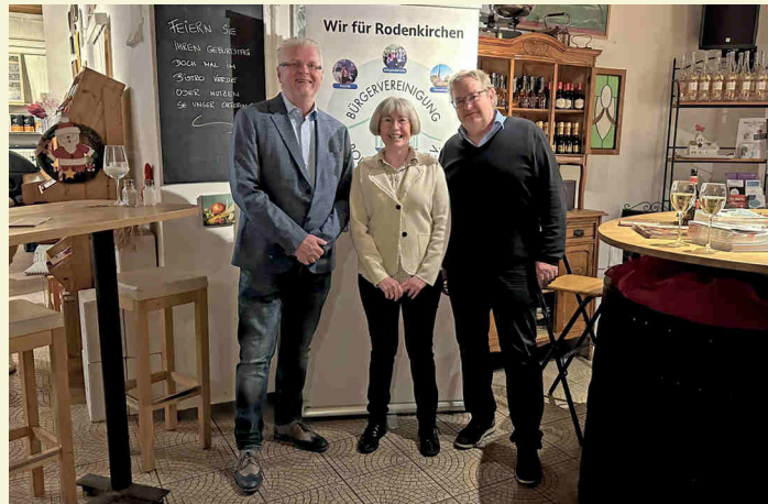
Geschäftsführender Vorstand der Bürgervereinigung Rodenkirchen

Anmeldung erforderlich mit Vor- und Zunamen und Personenzahl bis zum 8.1.2026 per Mail an info@buergervereinigung-rodenkirchen.de oder telefonisch 0221 3403444 (AB). Die Personenzahl ist begrenzt.