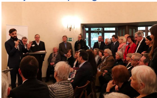
Unser letzter Neujahrsempfang im Jahr 2020 in Präsenz

Unseren traditionellen Neujahrsempfang planen wir derzeit am Sonntag, 23. Januar 2022 am späten Vormittag. Leider ist derzeit nicht einschätzbar, ob im Januar wieder Veranstaltungen in geschlossenen Räumen mit über 200 Gästen überhaupt möglich sein werden. Deshalb wird der Neujahrsempfang voraussichtlich in einer digitalen Form mit dem Vorstand sowie einzelnen Gastrednerinnen und Gastrednern stattfinden und in YouTube als Livestream übertragen. Weitere Informationen erhalten Sie dazu Anfang des neuen Jahres. Alternativ